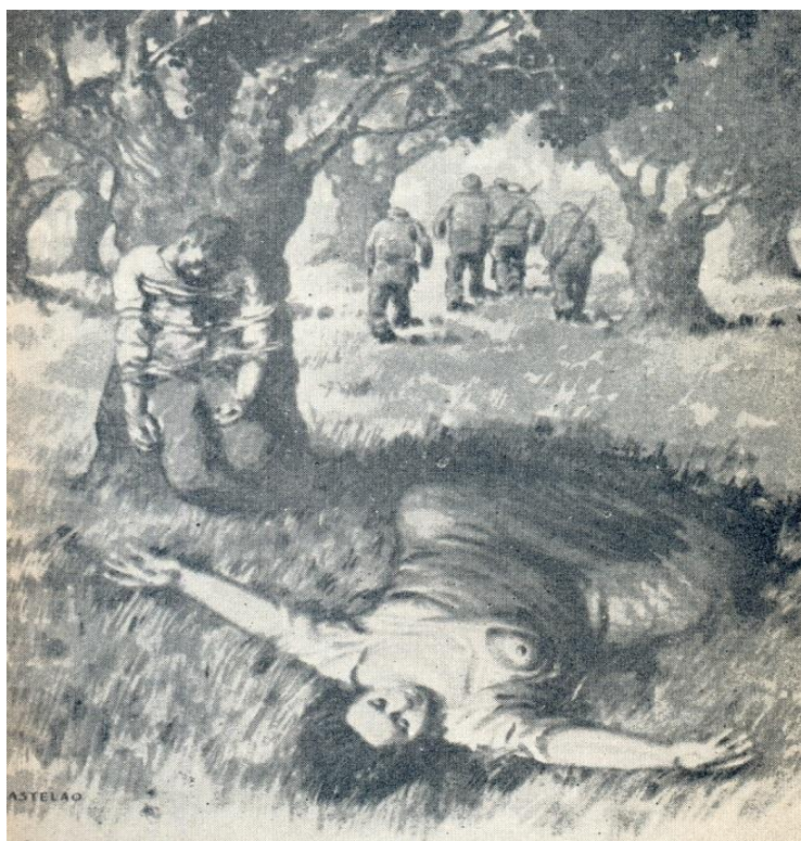
Dibujo de Castelao Mujer y hombre asesinados por los falangistas