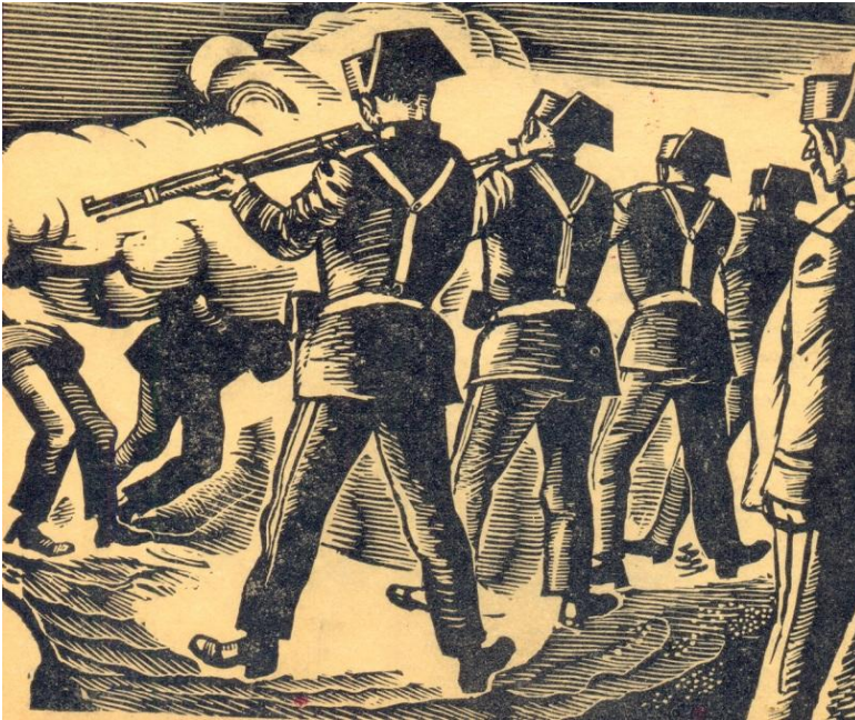
Grabado La Guardia Civil fusilando a paisanos durante la noche franquista

Ante la derrota militar, exiliado en Francia fue a parar a los campos de Concentración de Argeles, después estuvo por un tiempo Chemin du Pont de la République 2 Villa les Acacia près Castanet a Nimes Card entre los meses de abril y julio de aquel fatídico año de 1939, otro de los domicilios que tuvo a los inicios de los cuarenta en Francia fue en Xucr, route de Sauve a Nimes.